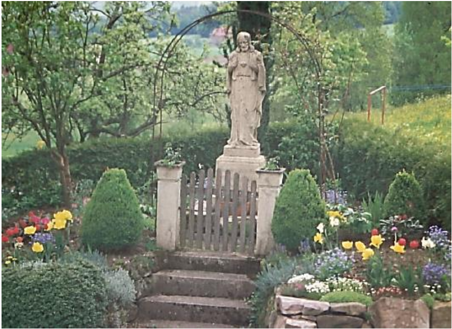
Herz Jesu Statue im Oberrod