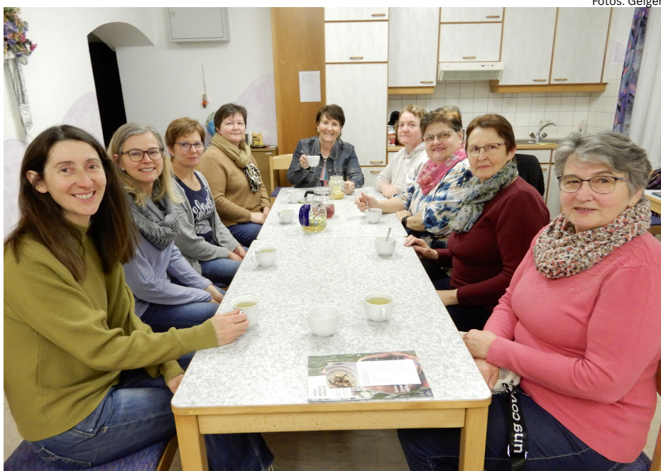
Mitglieder der kath. Frauenbewegung