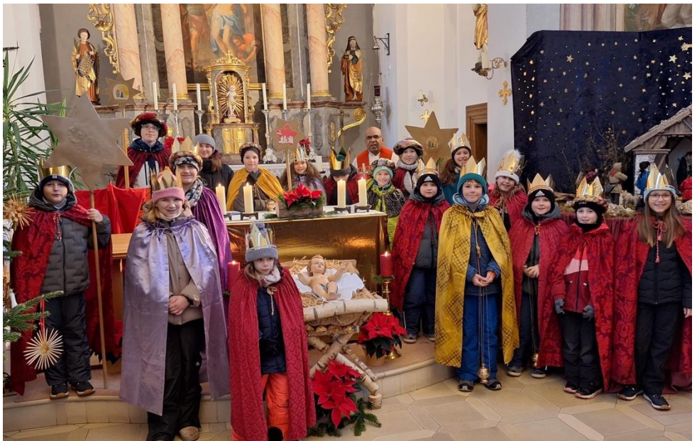
Sternsinger aus Lengfeld und Alkofen