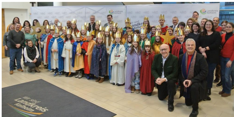
Die Sternsinger aus Teugn, Lengfeld und Alkofen waren im Landratsamt Kelheim und wurden von Landrat Herrn Neumayer empfangen

Viele hundert Sternsinger/-innen waren rund um Neujahr wieder überall in den Städten und Dörfern unterwegs. Sie waren Teil der 68. Aktion Dreikönigssingen unter dem Motto „Schule statt Fabrik– Sternsingen gegen Kinderarbeit“, bei der sich die Hl. Drei Könige in diesem Jahr besonders für Kinder im südostasiatischen Bangladesch einsetzen, welches im Fokus der Aktion Dreikönigssingen 2026 steht. Dieser Tradition des Sternsingens, die inzwischen weltweit größte Solidaritätsaktion, in der sich Kinder für Kinder in Not engagieren, haben sich auch die Sternsinger der Pfarrgemeinde Teugn, Lengfeld und Alkofen wieder gerne angeschlossen, um in der Nachfolge der Heiligen Drei Könige den Segen „Christus Mansionem Benedicat – Christus segne dieses Haus“ zu den Menschen zu bringen und so für benachteiligte Kinder in Bangladesch und aller Welt zu sammeln und dadurch selbst zum Segen zu werden. Dank der vielen Spenderinnen und Spender, die die Sternsingerinnen und Sternsinger an den Türen mit großzügigen Gaben unterstützt haben, konnte eine Spendensumme von 5.133,55 € erreicht werden. Dafür sagen die Sternsinger der Pfarrgemeinde Teugn, Lengfeld und Alkofen ein herzliches Vergelt's Gott!