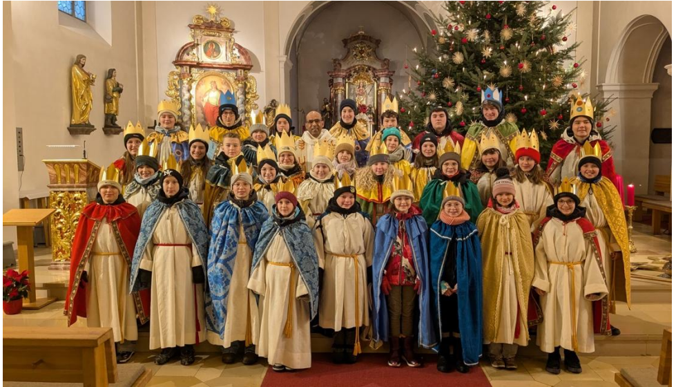
Sternsinger aus Teugn