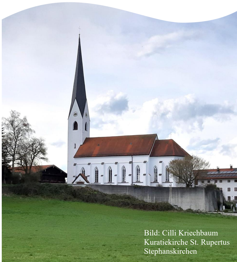
Kuratiekirche St. Rupertus Stephanskirchen