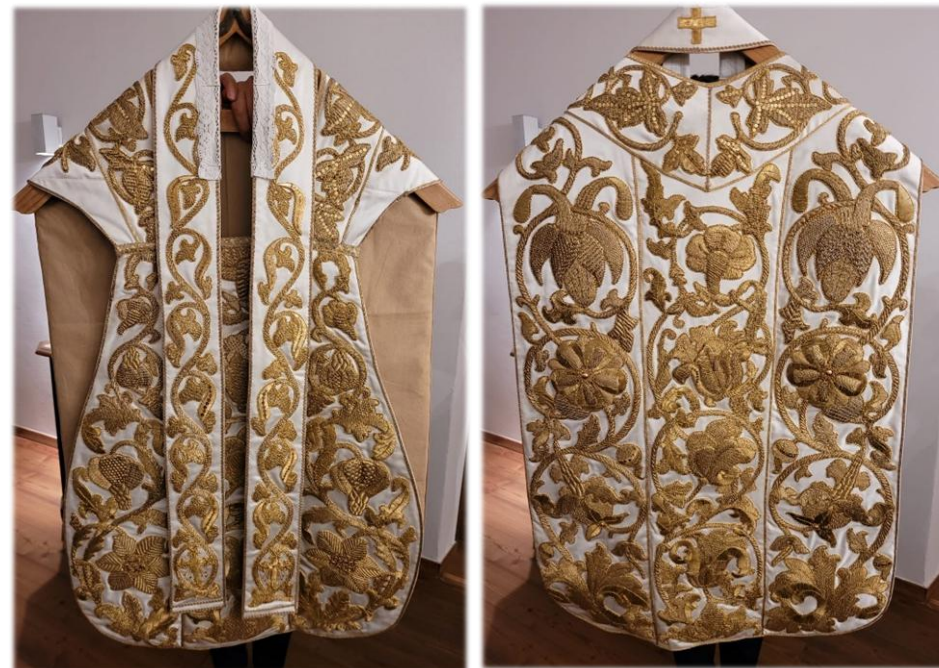
Kasel weiß, reichlich mit goldfarbenen Blumenmustern verziert.

Pfarrei Maria Himmelfahrt Bruneck - Jg. 27 - Nr. 3 - 2026