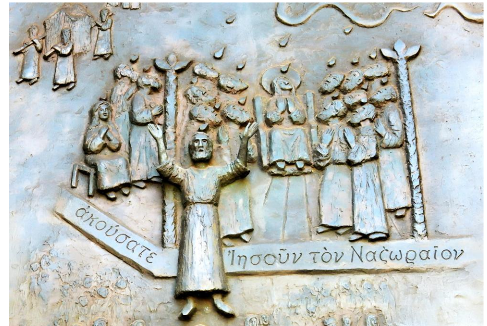
Willi Dix (Künstler)

Pfarrei Maria Himmelfahrt Bruneck - Jg. 27 - Nr. 10 - 2026