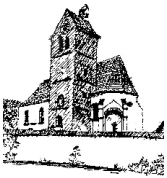
St. Quirin – Staudheim