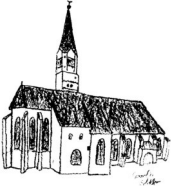
St. Johannes d. Täufer Rain