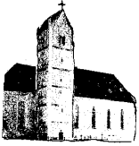
St. Peter und Paul Genderkingen