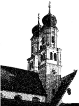
Mariä Himmelfahrt Niederschönenfeld