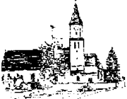
St. Georg – Feldheim