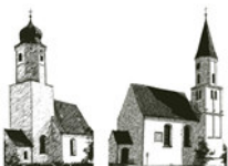
St. Jakobus – St. Georg Unterpeiching Mittelstetten