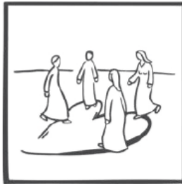
Il diko Zavrakidis

» In jener Zeit sprach Jesus zu seinen Jüngern: Wenn ihr mich liebt, werdet ihr meine Gebote halten. Und ich werde den Vater bitten und er wird euch einen anderen Beistand geben, der für immer bei euch bleiben soll, den Geist der Wahrheit, den die Welt nicht empfangen kann, weil sie ihn nicht sieht und nicht kennt. «