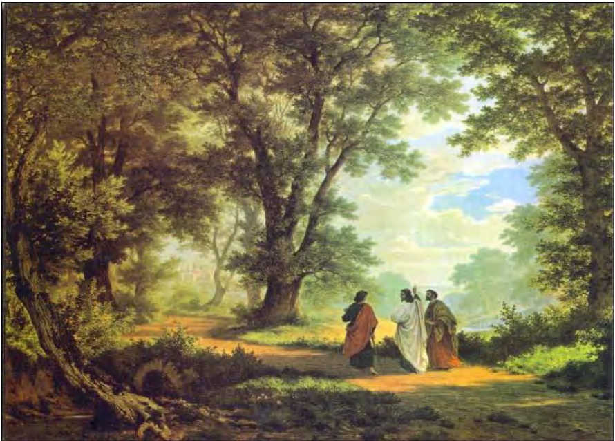
Robert Zünd, Gang nach Emmaus, 1877