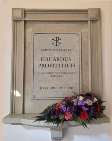
Gedenkstein in der Kathedrale St. Peter und Paul Tallinn