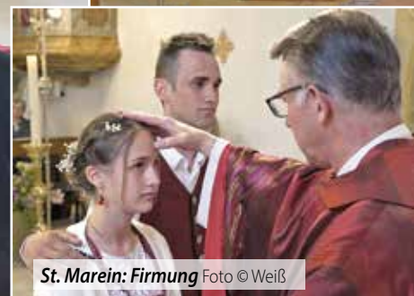
St. Marein: Firmung