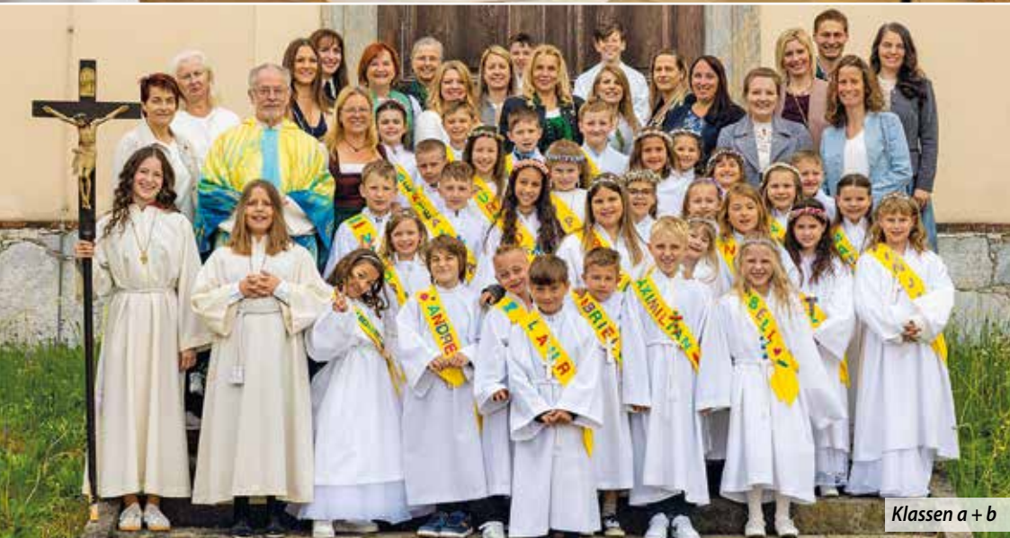
Klassen a + b