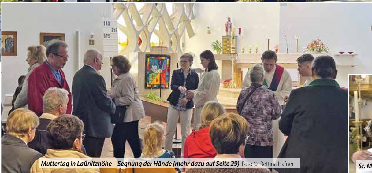
Muttertag in Laßnitzhöhe – Segnung der Hände (mehr dazu auf Seite 29)