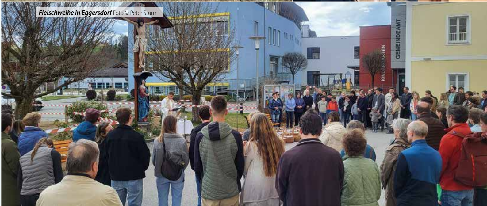
Fleischweihe in Eggersdorf