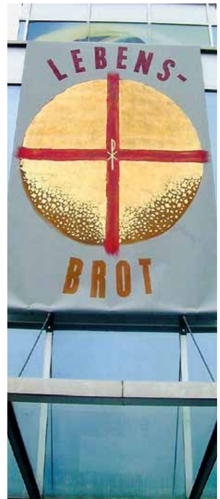
Für die Pfarre Gleisdorf hat Helmut Loder 2008 eine Fronleichnamsfahne mit diesem Motiv des Brotgotts („LEBENS.BROT“) gestaltet.