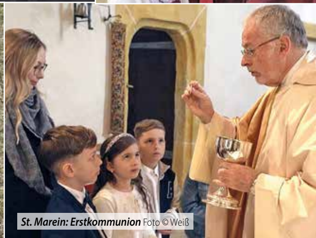
St. Marein: Erstkommunion Foto © Weiß