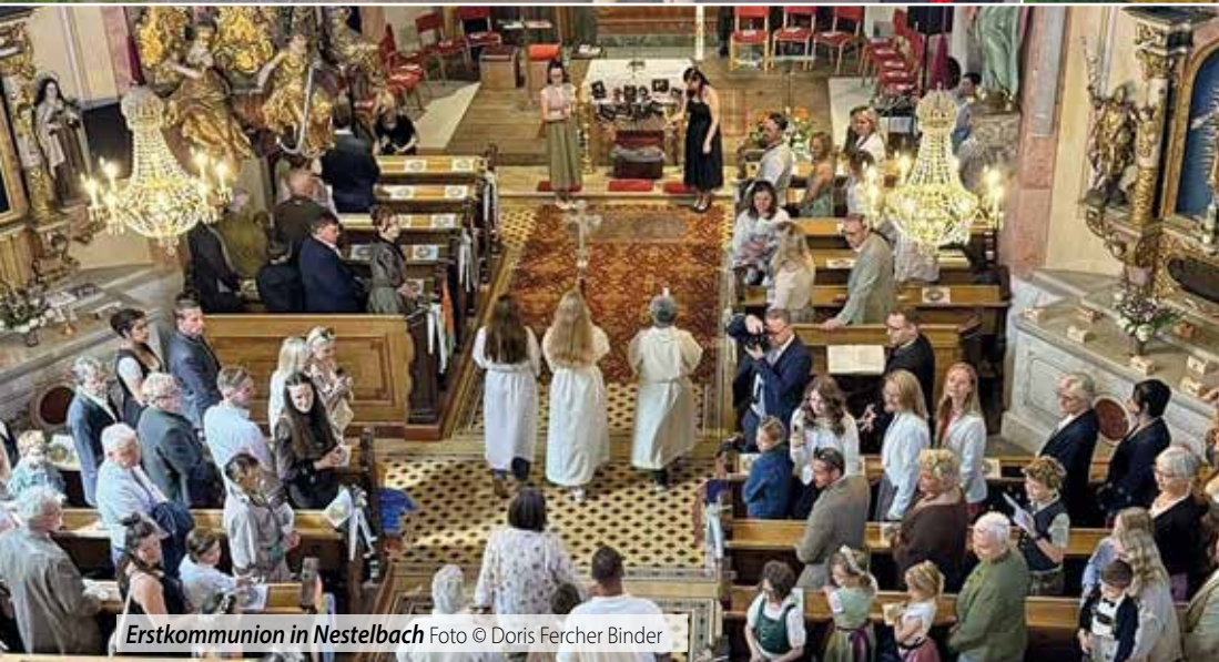
Erstkommunion in Nestelbach