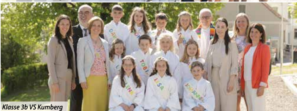
Klasse 3b VS Kumberg