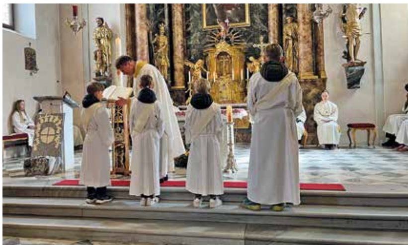
Kumberg: in einer berührenden Zeremonie werden ein Mädchen und drei Buben in die Ministrantengemeinschaft aufgenommen