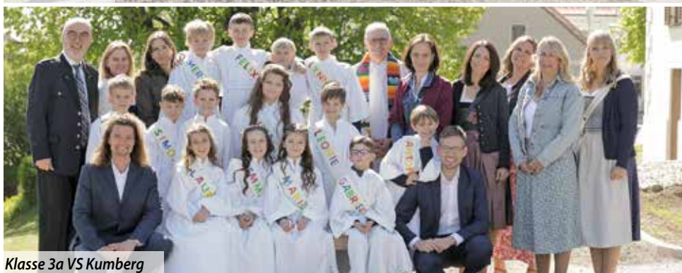
Klasse 3a VS Kumberg