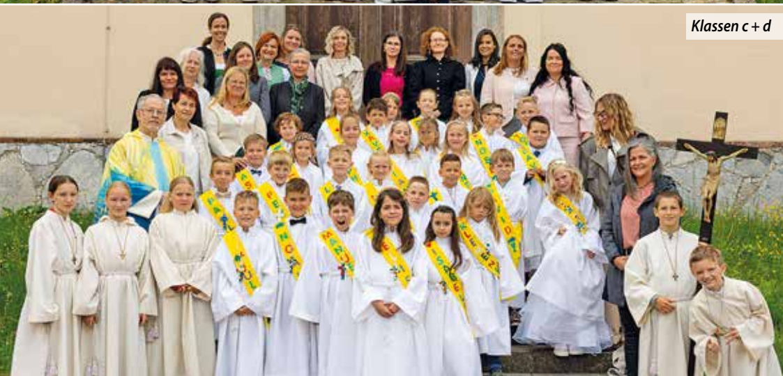
Klassen c + d