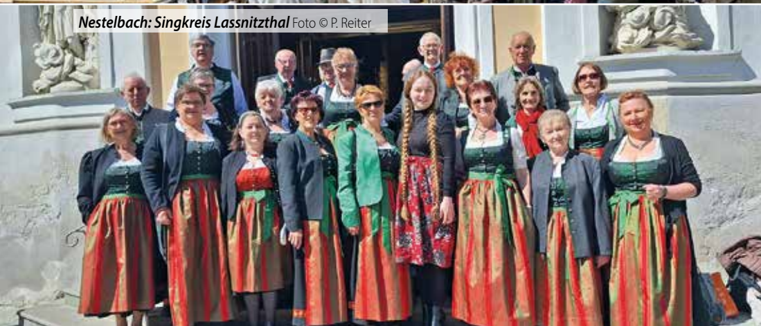
Nestelbach: Singkreis Lassnitzthal