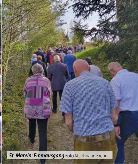
St. Marein: Emmausgang