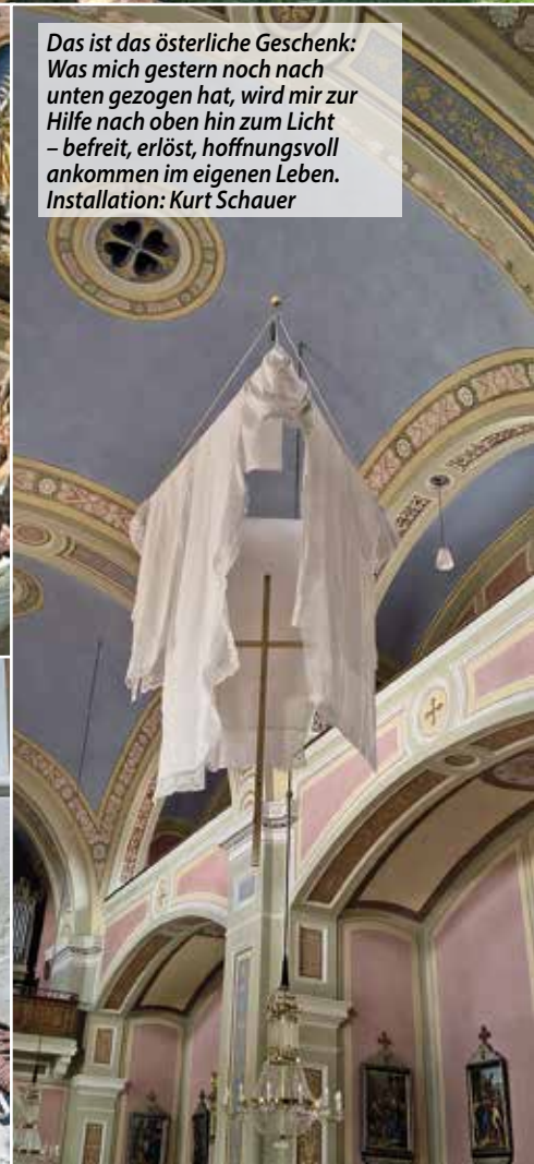
Das ist das österliche Geschenk: Was mich gestern noch nach unten gezogen hat, wird mir zur Hilfe nach oben hin zum Licht – befreit, erlöst, hoffnungsvoll ankommen im eigenen Leben. Installation: Kurt Schauer