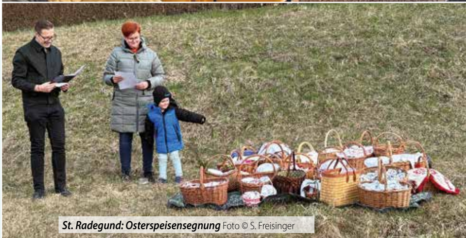
St. Radegund: Osterspisesegnung