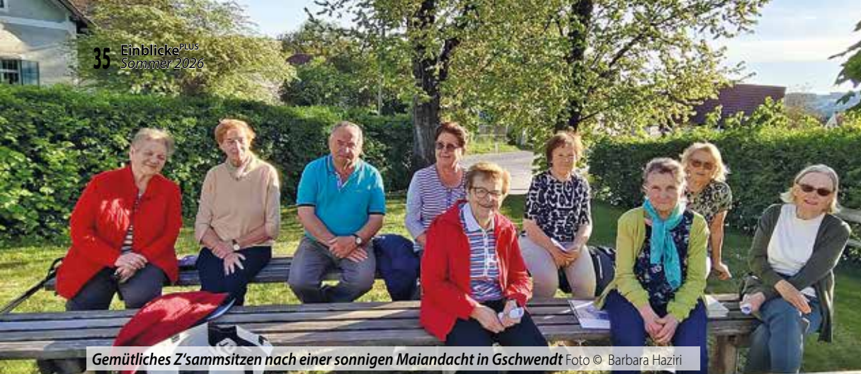
Gemütliches Z'sammsitzen nach einer sonnigen Maiandacht in Gschwendt