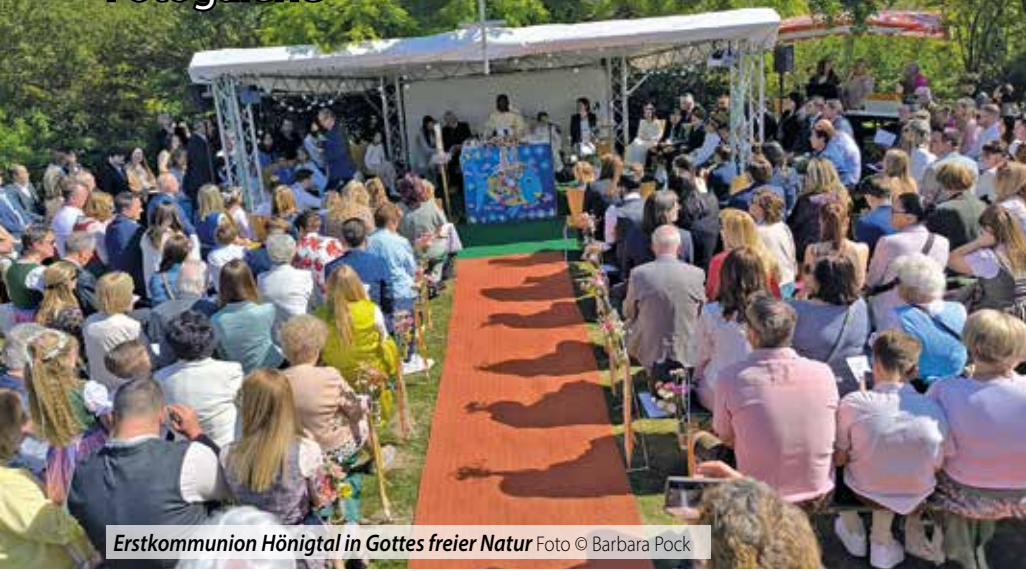
Erstkommunion Hönigtal in Gottes freier Natur