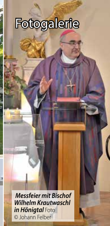
Messefeier mit Bischof Wilhelm Krautwaschl in Hönigstal