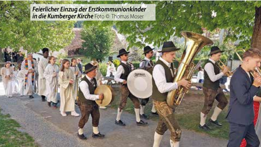
Feierlicher Einzug der Erstkommunionkinder in die Kumberger Kirche