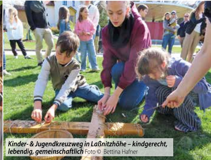
Kinder- & Jugendkreuzweg in Laßnitzhöhe – kindgerecht, lebendig, gemeinschaftlich