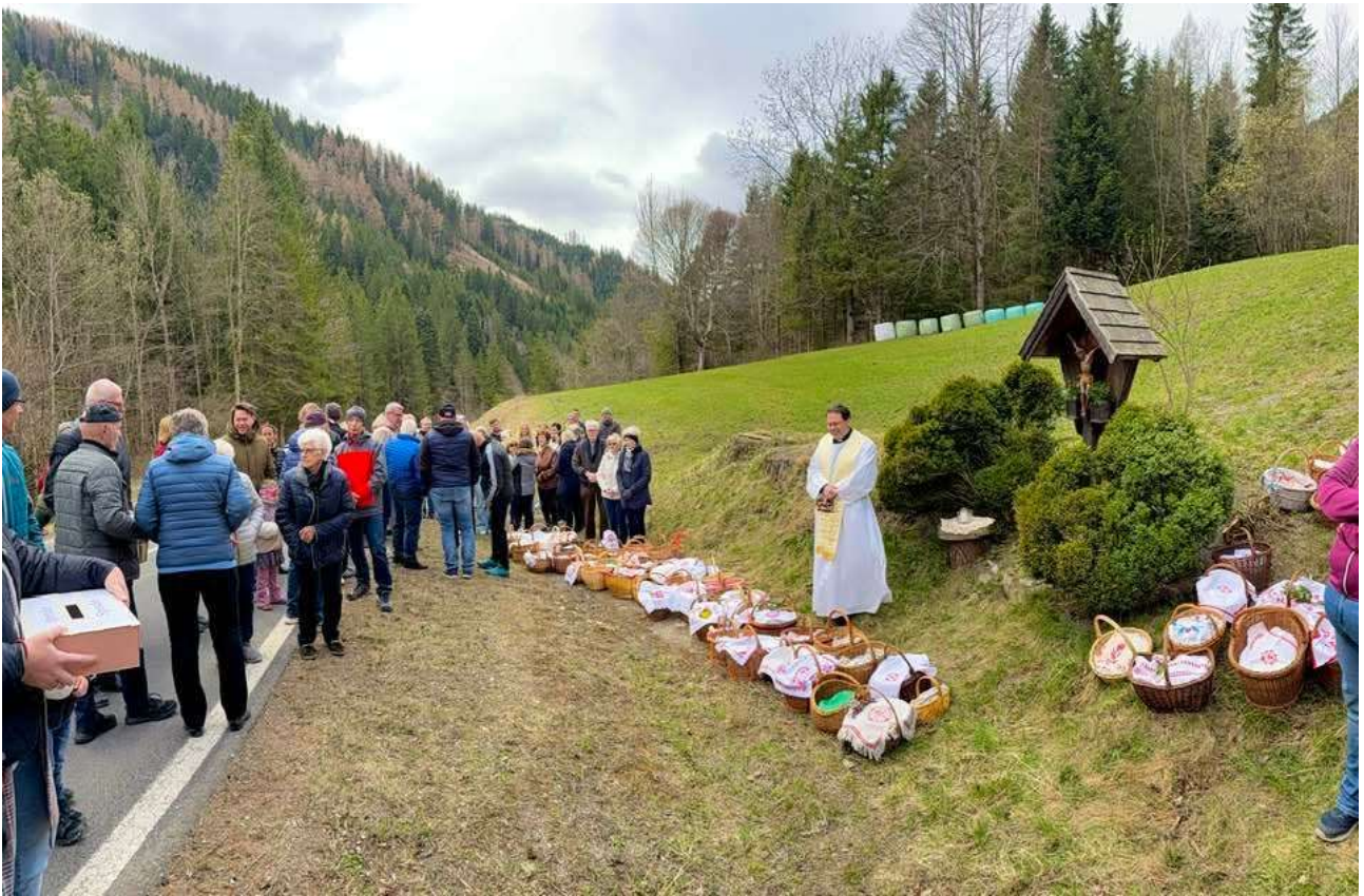
Segnung der Osterspeisen