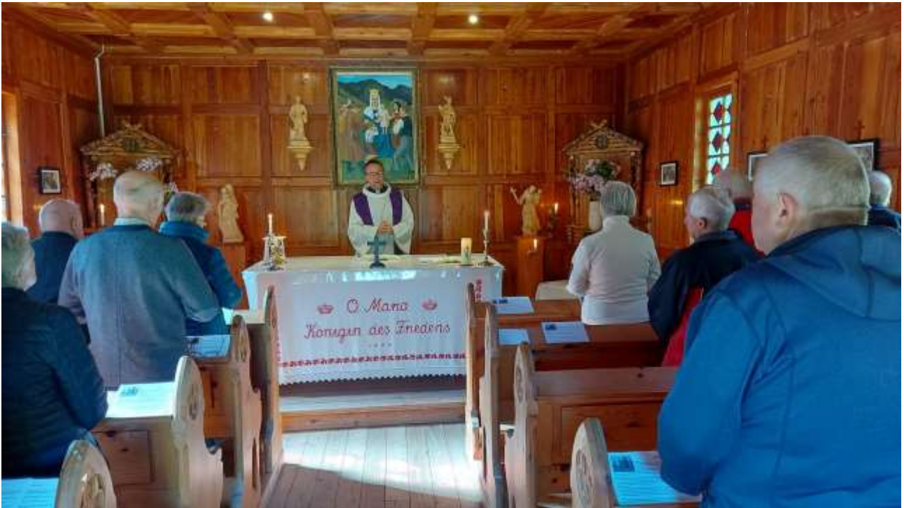
Maiandacht beim Pretterer Kreuz