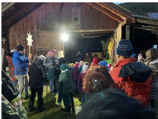
Waldweihnacht in Hammereisenbach