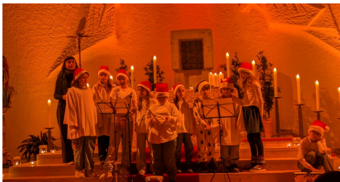
Adventsimpuls in Gütenbach