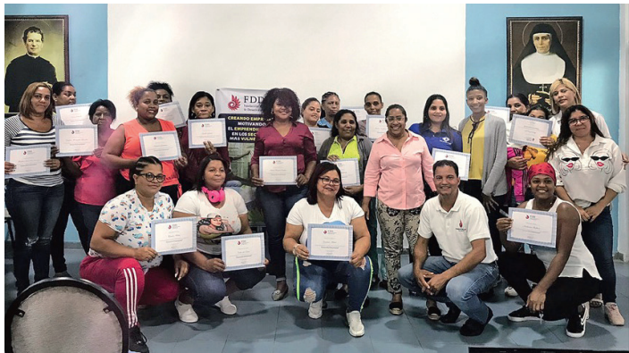
Bildung stärkt Mütter und sichert die Zukunft ihrer Kinder.

60 Gesprächsgruppen rund um Goldminen sensibilisieren die Schürfer für die Gefahren ihrer Arbeit. Diese Unterstützung hilft ihnen, sich ihrer Rechte bewusst zu werden, und motiviert sie, sich für den Zugang zu eigenem Land einzusetzen.