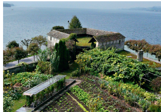
Blick aus einer Zelle auf Klostergarten und Zürichsee.