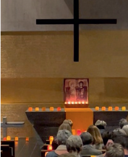
Kerzenlicht zum Taizégebet in Baldegg.