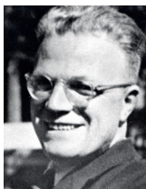
Widerstandskämpfer Alfred Delp.

Delp war Mitglied des Kreisauer Kreises im Widerstand gegen den Nationalsozialismus, was ihn schliesslich sein Leben kostete.