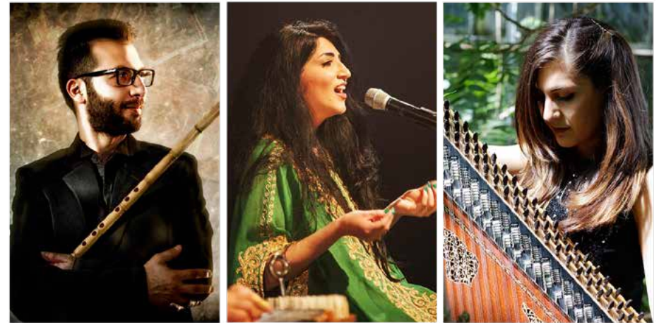
Das Ensemble „Oriental Echo“