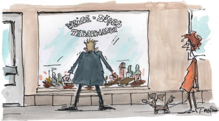
FASTENHELDEN.. HÄRTEST.. HERBERT P.. HALBE STUNDE DURCHHALTEN

Ein Kellner bricht plötzlich zusammen und wird ins Krankenhaus gebracht. Als er auf dem Operationstisch liegt, geht ein Chirurg vorbei, den er kennt. „Herr Doktor, Sie müssen mir helfen!“, fleht der Kellner. Darauf der Chirurg: „Bedauere, das ist nicht mein Tisch!“