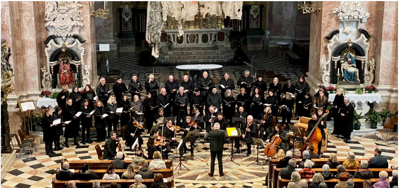
Innsbrucker Domkonzert zur Fastenzeit: „Mein Herr und mein Gott“