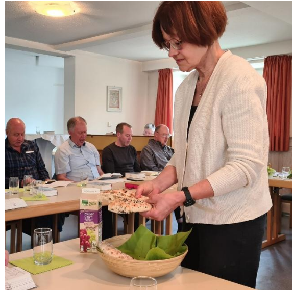
C. Rehberg / S. Tepel

Neugierig geworden? Dann feiern Sie mit: Agapefeier am Sonntag, 17.05., um 10.30 Uhr im Gemeindehaus Ahldorf.