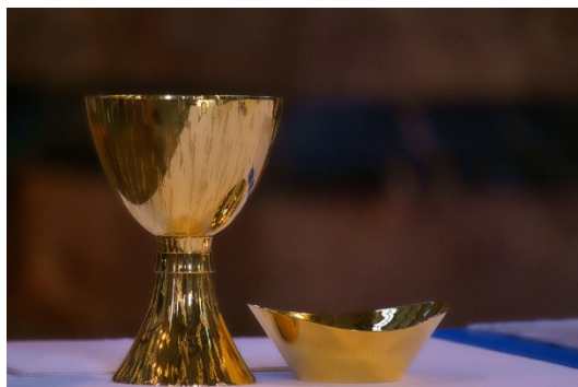
music4life / Pixabay.com - Lizenz

GL 09:00 Hl. Messe , anschl. Frühstück im Selig