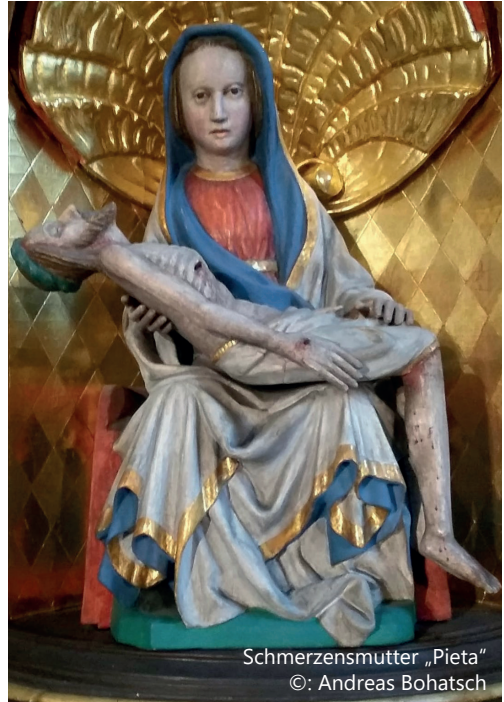
Schmerzensmutter „Pietà“

In diesem Zuge bekommt die „Klagemauer“ ein neues Aussehen und einen neuen Platz an der Wand hinten beim „Herz Jesu“.