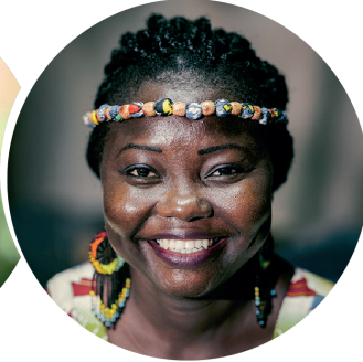
Gestaltung: U. Kleine (Crisis Medien); Fotos: K. Harms, Klaus Meierhahn