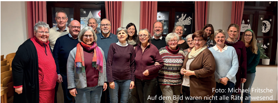
Auf dem Bild waren nicht alle Räte anwesend

Wir werden zukünftig im Pfarrbrief immer wieder aus diesem ehrenamtlichen Gremium informieren.