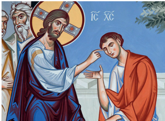
Zentralmotiv im Fastentuch von St. Johannes Nepomuk, Garitz : Hab Mut, steh auf (Mk 10, 46-52)

Das Fastentuch (auch Hungertuch, Palmtuch, Passionstuch oder Schmachtlappen), Lateinisch: velum quadragesimale = 'Tuch der 40 Tage', verhüllt in der Fastenzeit (Quadragesima) in katholischen und evangelischen Kirchen die Darstellungen des Kreuzes, häufig nur den Hauptaltar. Es erinnert an den jüdischen Tempelvorhang, der im Neuen Testament im Zusammenhang mit dem Kreuzestod Jesu mehrfach erwähnt wird. Die ersten Fastentücher sind seit dem 10. Jahrhundert bezeugt und mittelalterlich kommentiert: „Dich sol leren das Hungertuch, so man ufspant, Abstinenz und Fasten.“ Die Bild- und Schaufreudigkeit des Spätmittelalters hat dazu beigetragen, die ursprünglich einfachen, farblosen Fastentücher mit Bildern und Symbolen zu bemalen, zu besticken oder zu bedrucken. Durch die reiche bildhafte Ausgestaltung ergaben sich Möglichkeiten für die volkstümliche religiöse Unterweisung mit dem Ziel, die Gläubigen während der Fasten- und Bußzeit eindringlich mit den Geheimnissen der Heilslehre vertraut zu machen. Fastentücher wurden und werden zumeist am Aschermittwoch im Kirchenraum aufgehängt und am Karsamstag wieder entfernt, damit der Altar wieder enthüllt seine Wirkung entfalten kann. Mit der Abnahme des Fastentuchs vor der Osternacht soll gezeigt werden, dass Jesus fortan wieder un verhüllt in seiner Göttlichkeit vor den Menschen steht und er es ist, der den Himmel für uns geöffnet hat.