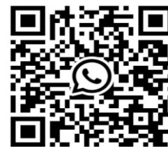
QR-Code für Familienangebote

Pfarrbüro Niederzissen Horststraße 35 - 56651 Niederzissen Tel: 02636/6166 Fax: 02636/6060