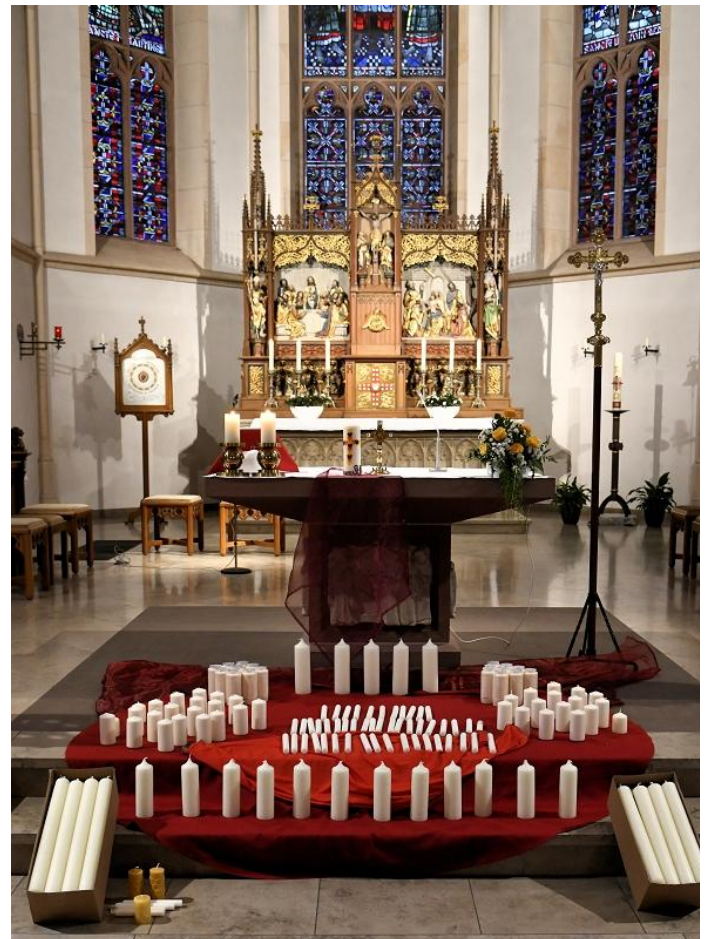
Kerzenweihe St. Martin Bad Lippspringe; Foto Bernhard Bauer