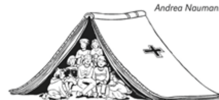
Mit Gottes Wort und seinem Segen

Der nächste Pfarrbrief-Mantelteil unserer großen Pfarreiengemeinschaft erscheint am Wochenende Samstag, 01. bzw. Sonntag, 02. August 2026. Der Redaktionsschluss für diesen Teil des Pfarrbriefes ist in allen Orten der Pfarreiengemeinschaft Montag, 27. Juli 2026 . Bitte beauftragen Sie rechtzeitig die Messintentionen für die kommenden Urlaubsmonate August und September und beachten Sie die Zeiten, wann die Pfarrbüros dann nicht besetzt sein werden. Der kommende Pfarrbrief gilt vom 03. August bis einschließlich 06. September 2026.