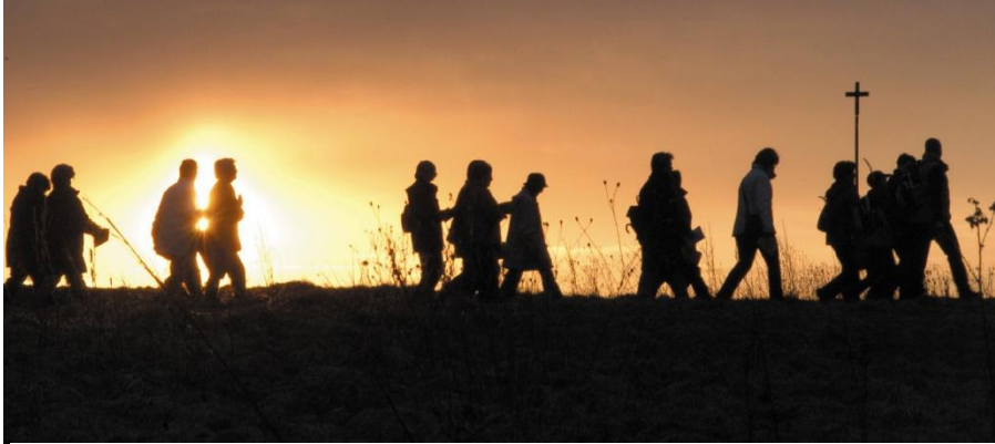
Paulus Decker, in: Pfarrbriefservice.de

Flurprozessionen waren früher feste Elemente im Laufe des Kirchenjahres. Die tägliche Arbeit verband die Menschen unmittelbar mit dem, was ausgesät wurde, auf den Feldern wuchs und im Herbst als Ernte