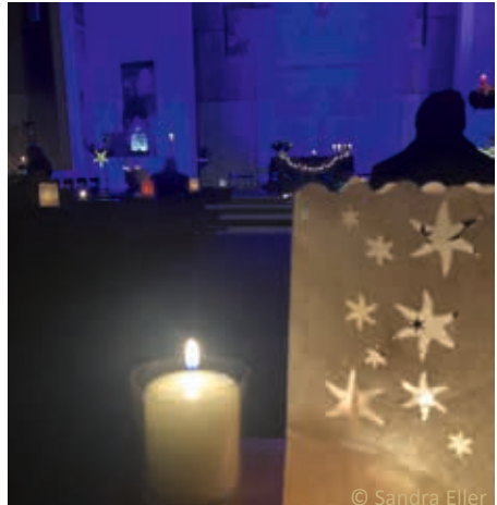
Gemeindeteam St. Antonius

Im Anschluss lädt das Gemeindeteam St. Antonius zu einem geselligen Beisammensein mit heißem Tee, Getränken und mehr ein. Herzliche Einladung!