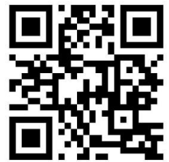
App Pastoraler Raum Betzdorf