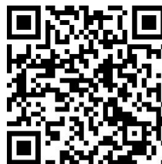
Homepage Pastoraler Raum Betzdorf

Redaktionsschluss für die März Ausgabe: 13.02.2026, 12:00 Uhr