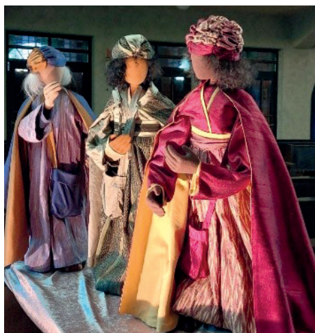
Szene aus der Dreikönigskirche Netstal

Im Neuen Testament werden sie weder als «Heilige» noch als «Könige» bezeichnet. Die in der Westkirche verbreiteten Namen Caspar, Melchior und Balthasar werden erstmals im 6. Jahrhundert erwähnt.