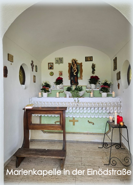
Marienkapelle in der Einödstraße