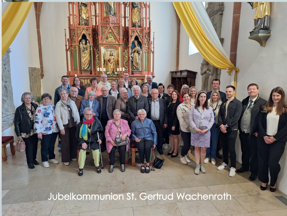
Jubelkommunion St. Gertrud Wachenroth