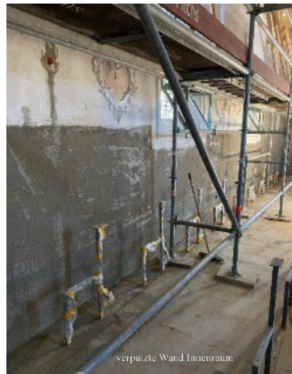
verputzte Wand Innenraum