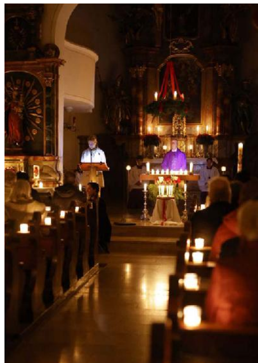
Roratefeier in St. Nikolaus

(PT) In der Coronazeit haben sich die Stärken des Gemeindeteams gezeigt: Wir waren schnell organisiert, haben uns verschiedene Formate ausgedacht. Wir haben Pilgerwege mit Stationen zum