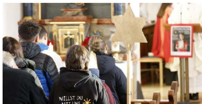
Aussendungsgottesdienst in St. Nikolaus Dingelsdorf

Beispielhaft für alle anderen hier die super Ergebnisse von den Bodanrückgemeinden: Litzelstetten: 2185,00 Euro – Dingelsdorf: 5855,61 Euro – Dettingen 2670,00 Euro. Vergelt's Gott Euch Sternsängern, ihr seid wirkliche Glücksbringer!