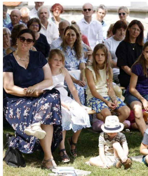
Familiengottesdienst im Freien

alleine Ablaufen aufgebaut. Wir haben im Freien gefeiert und Lied-Meditationen im Freien gesungen und Online-Übertragungen aufgebaut. Hier konnte man gut sehen, dass wir geschaut haben, was die Gemeinde vor Ort brauchte, und auch mutig Sachen schnell umgesetzt haben. (PH) Das Gemeindeteam hat das Pfarrfest weiterentwickelt, mit mehr Anknüpfungsmöglichkeiten für Familien, die nun dort präsenter sind. Wir halten einen engen Kontakt zum Kinderhaus, und die Gemeinde profitiert, wenn Erzieherinnen und Erzieher beim Patrozinium Angebote machen und generell Gottesdienste und Angebote mitgestalten.