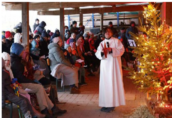
Krippenfeier auf dem Fuchshof

(PT) Wir haben in den letzten Jahren viel Gemeinsames aufgebaut mit den beiden Nachbargemeinden auf dem Bodanrück. Es wäre schade, wenn das jetzt wieder verloren gehen würde.“ (PH) Im Moment sind in der neuen Pfarrei noch viele Fragen offen und der Start war sehr holprig. Wir sind ganz guter Dinge, dass sich vieles in den nächsten Wochen klären wird. Das ist auch notwendig, sonst verlieren wir uns im Nebel aus den Augen.