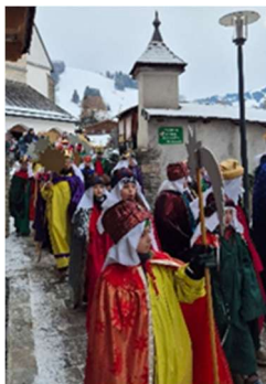
Text und Bild: N. Widauer

Herzlichen Dank für den großartigen Einsatz aller Beteiligten und natürlich vielen herzlichen Dank für die zahlreichen Spenden!