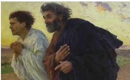
Johannes und Petrus auf dem Weg zum Grab