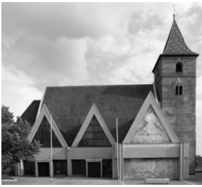
St. Jakobus, Ornbau