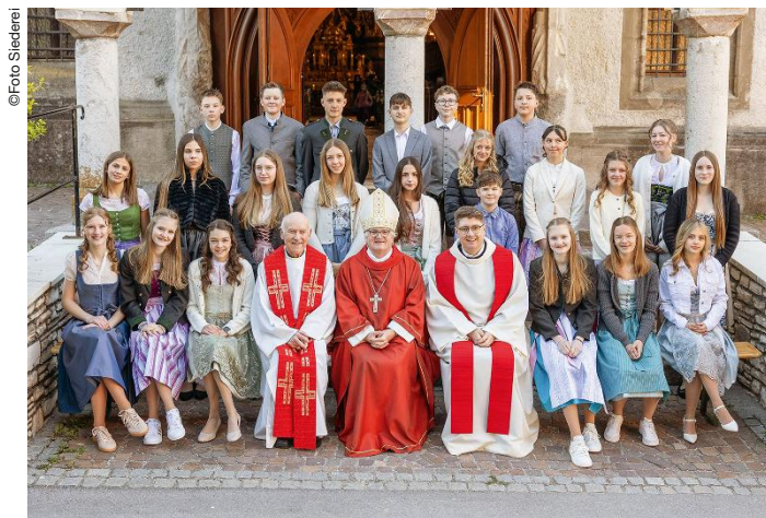
25. April: Gröbming

An sechs Pfarrorten in unserem SeelsorgeRaum empfangen heuer Jugendliche von drei Firm Spendern das Sakrament der Firmung. Die ihnen dabei zugesprochene Stärkung soll sie in der herausfordernden Zeit des Erwachsenwerdens unterstützen und ist eine Einladung, immer wieder Wege zu finden, den Glauben zu leben. Den jungen Menschen Gottes Segen für ihre Zukunft!