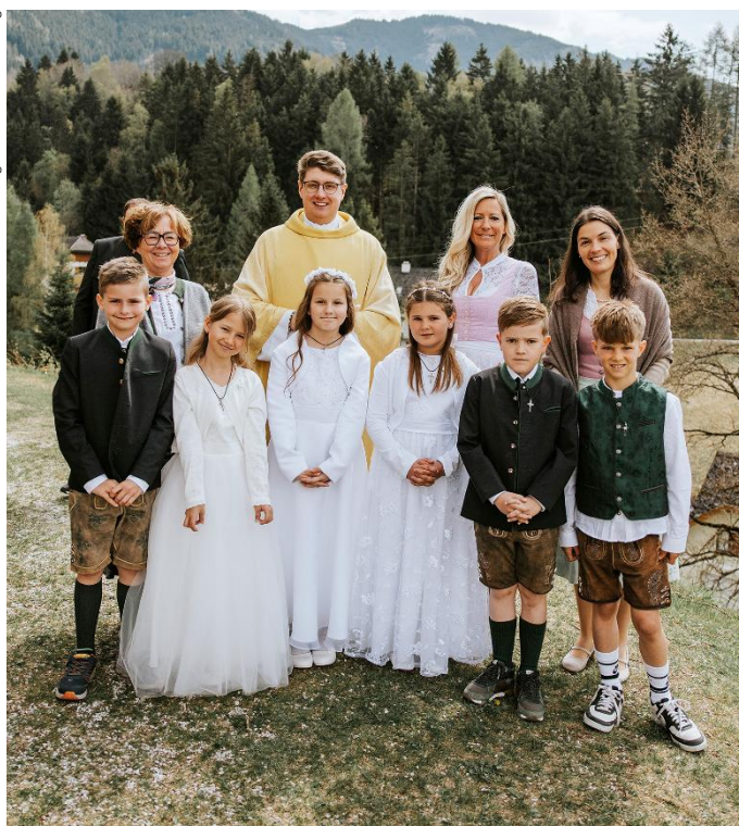
19. April: Gröbming/Stein a.d.Enns