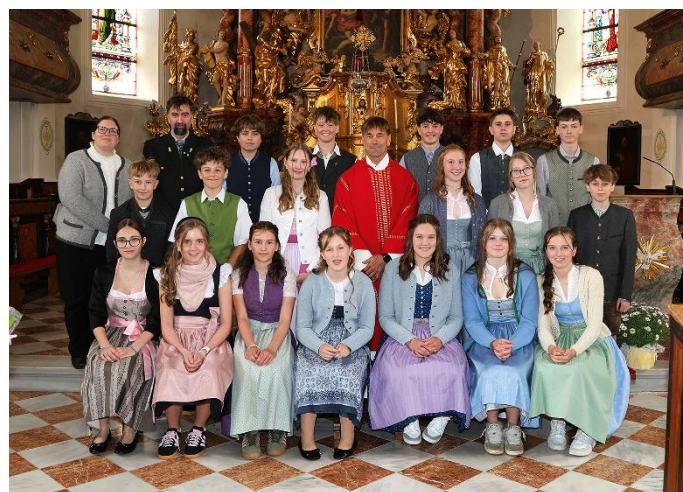
16. Mai: Haus