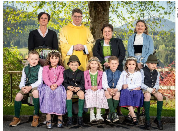
26. April: St. Martin

Viel haben die Kinder selbst beigetragen und so die Feier ihrer Erstkommunion gemeinsam mit ihren Familien und Paten zu einem unvergesslichen Erlebnis gemacht. Herzlichen Dank allen, die mitgeholfen haben!