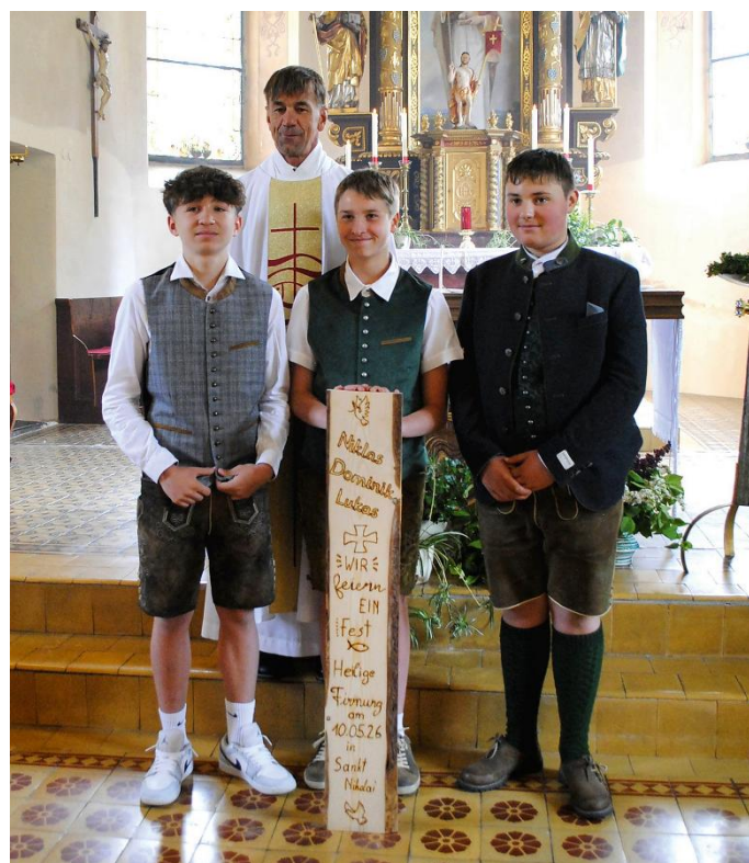
10. Mai: St. Nikolai