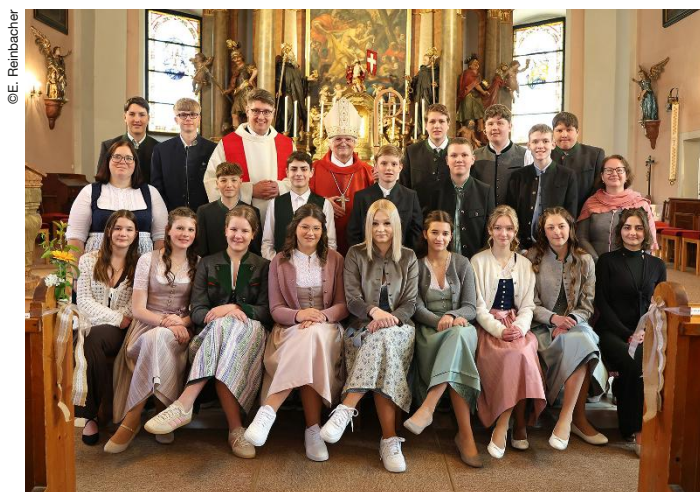
25. April: Öblarn