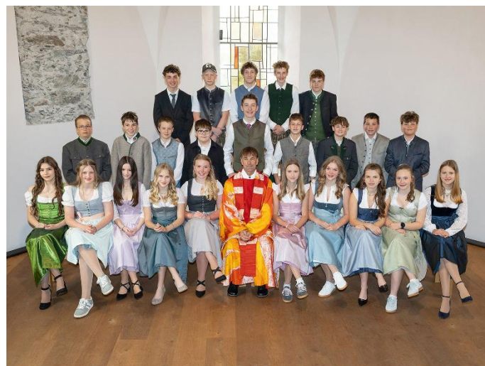
16. Mai: Schladming