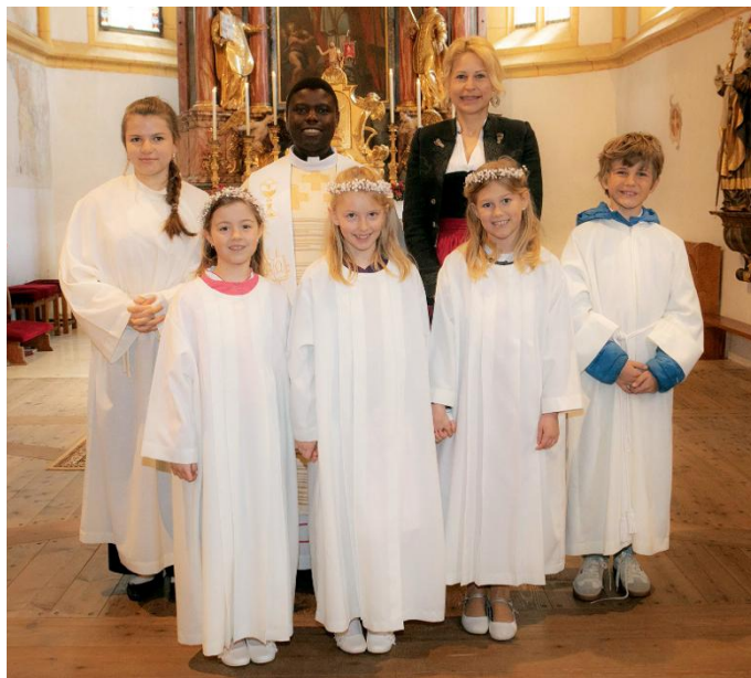
19. April: Kulm/Ramsau