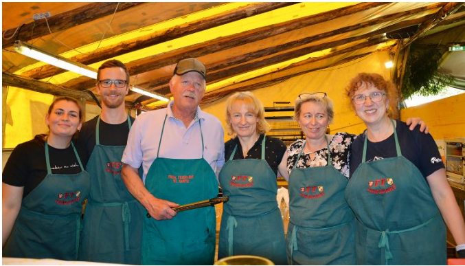
Der PGR St. Martin beteiligte sich bei der Benefizveranstaltung zugunsten jener Familie aus Tipschern, die einen Wohnhausbrand erlitten hatte.