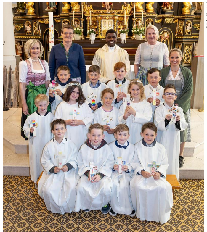
26. April: Schladming