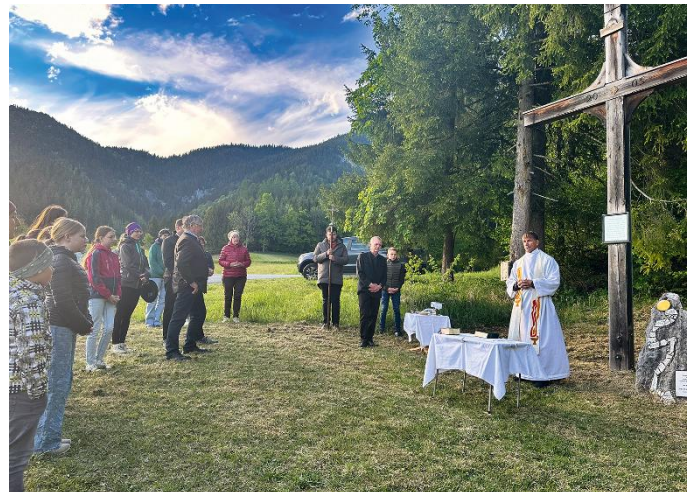
Bittgang der Pfarre Assach zum Schaidwegkreuz

Gerade in der heutigen Zeit gewinnen die Bitttage neue Bedeutung: Wetterextreme, Sorgen um Frieden, Gesundheit und ein gutes Miteinander zeigen uns, wie wenig selbstverständlich vieles ist. Der Mensch kann vieles planen, aber wir dürfen auch vertrauen und um Gottes Begleitung bitten.