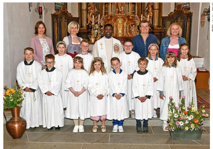
3. Mai: Pichl