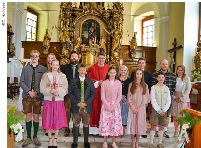
1. Mai: St. Martin