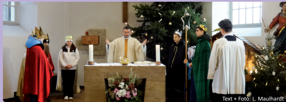
Text + Foto: L. Maulhardt

Wir möchte hiermit unseren Kindern und Jugendlichen, die als Sternsinger unterwegs waren, und auch den Begleitern ein herzliches Dankeschön sagen!