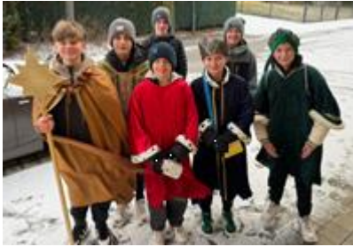
Michldorf 2.408,38 €