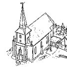
St. Matthäus Bodensee