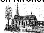
St. Laurentius Gieboldehausen