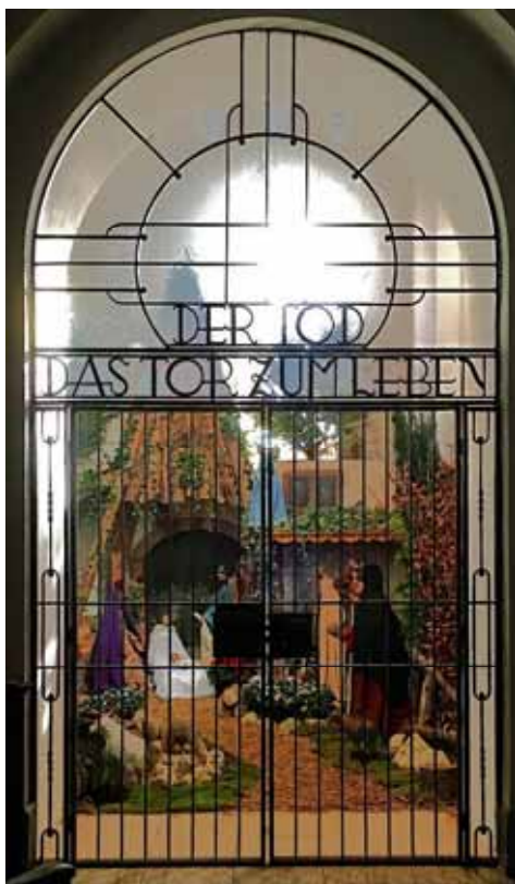
Krippe in der Kriegerkapelle St. Severin im Jahr 2016

Lassen sie das Bild in der Adventszeit auf sich wirken und finden sie ihre eigene Interpretation.