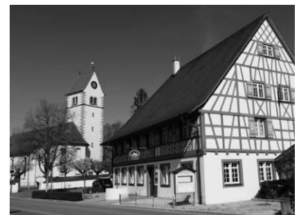
Heimatmuseum im Haus Montfort mit Gasthaus zur Dorfhaube

Wir freuen uns über zahlreiche Besucher Der Heimatverein Das Museumsteam