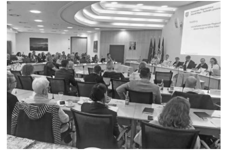
Zweite Pflegekonferenz im Bodenseekreis

https://www.bodenseekreis.de/zukunft-pflege