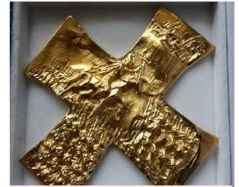
Das Ulrichskreuz in Gold zeigt auf der Vorderseite die Schlacht auf dem Lechfeld.

Die Ausstellung zeigt die weltgrößte Samm-