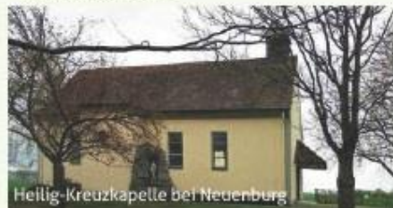
Heilig-Kreuzkapelle bei Neuenburg