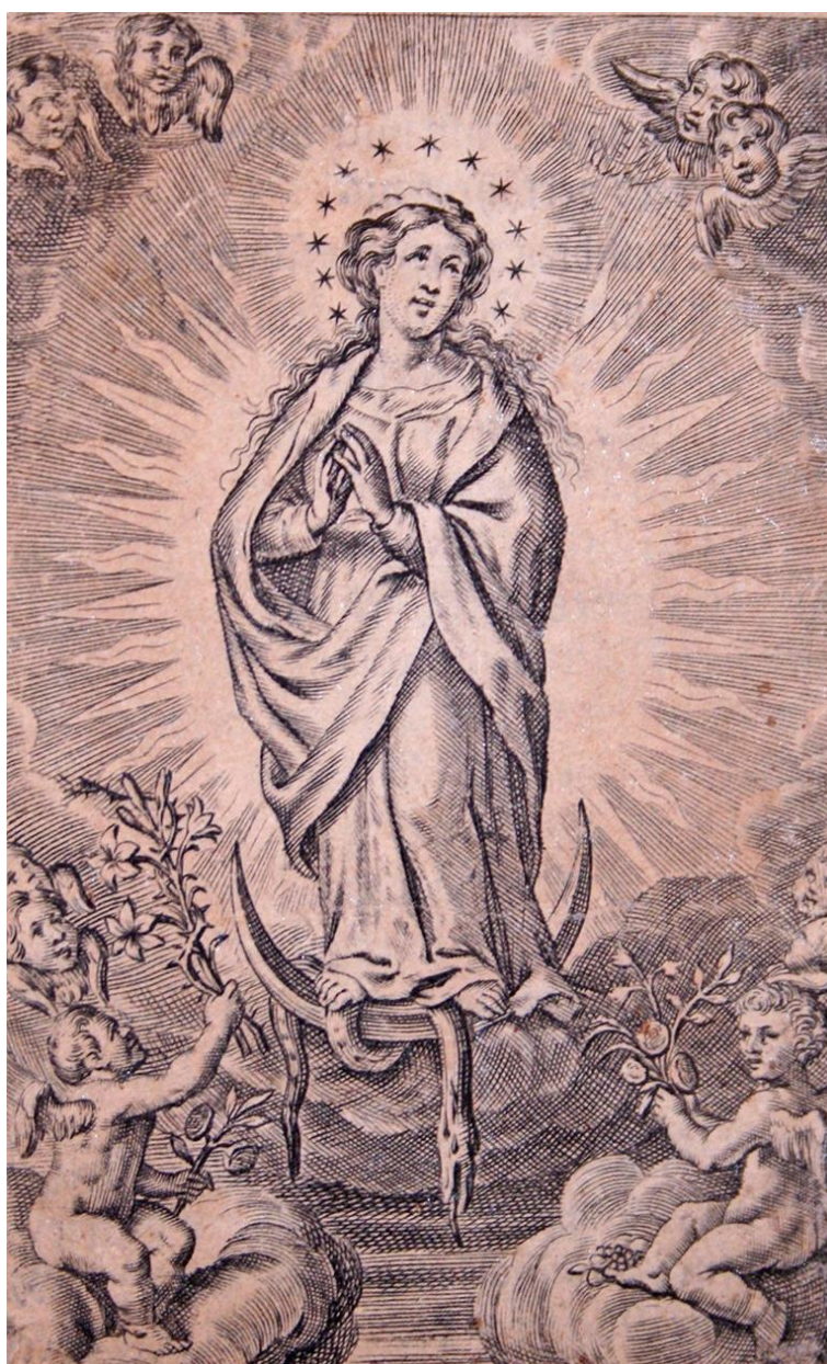
Gnadenbild des Mariendoms „Maria, Königin des Friedens“ in Neviges