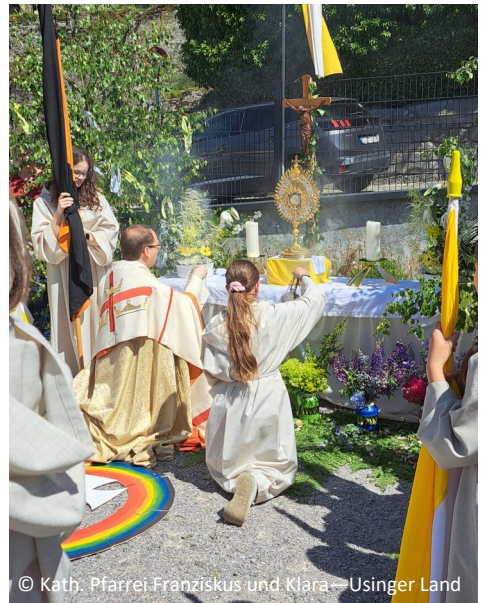
© Kath. Pfarrei Franziskus und Klara – Usinger Land

St. Georg Oberreifenberg: Gottesdienst um 15.00 Uhr mit anschließender Prozession durch unsere Gemeinde. Die Prozession führt uns an vier Altären vorbei. Prozessionsweg: Schulstraße, Brunhildensteg, Hochstraße, Siegfriedstraße, Vorstadt und zurück zur Kirche. Wir freuen uns, wenn Sie als Anwohner:innen die Straßen und Häuser festlich schmücken. Unterstützt werden wir von der Kanoniergesellschaft mit Böllerschüssen, die im Anschluss an die Prozession auf die Burg zum Umtrunk und Dämerschoppen einlädt.