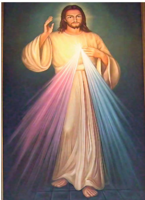
Gnadenbild vom barmherzigen Jesus

Der Barmherzigkeitssonntag (auch Sonntag der Göttlichen Barmherzigkeit) ist der erste Sonntag nach Ostern und wurde 2000 von Papst Johannes Paul II. eingeführt, basierend auf den Visionen der Heiligen Faustina Kowalska, um die unerschöpfliche göttliche Barmherzigkeit zu feiern. Dieser Tag lädt ein, das Bild des Barmherzigen Jesus zu verehren.