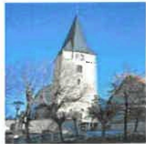
Breitenbach St. Margaretha