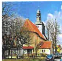
Breitenholz Mariä Heimsuchung