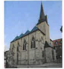
Birkungen St. Johannes d. Täufer