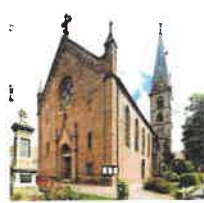
Wingerode St. Johannes d. Täufer