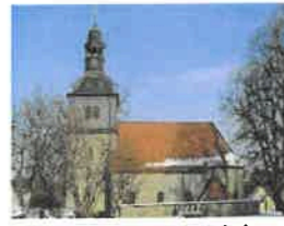
Lfd. St. Maria Magdalena Alte Kirche