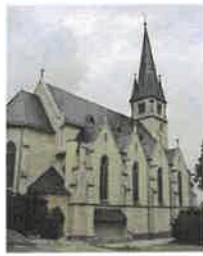
Lfd. St. Maria Magdalena Pfarrkirche