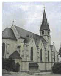
Lfd. St. Maria Magdalena Pfarrkirche