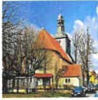
Breitenholz Mariä Heimsuchung