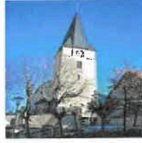
Breitenbach St. Margaretha