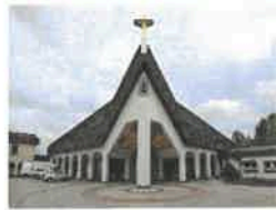
Leinefelde/Südstadt St. Bonifatius