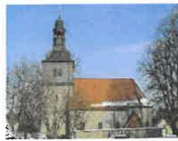
Lfd. St. Maria Magdalena Alte Kirche