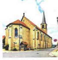
Beuren St. Pankratius