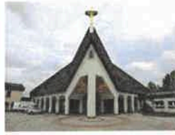
Leinefelde/Südstadt St. Bonifatius