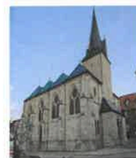
Birkungen St. Johannes d. Täufer