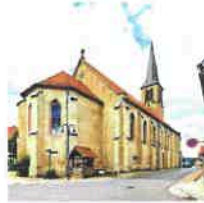
Beuren St. Pankratius