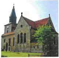
Kallmerode St. Martin