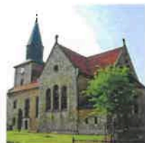
Kallmerode St. Martin