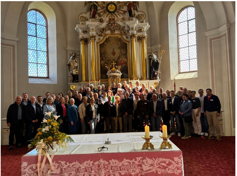
Die Gremienmitglieder der Pfarrgemeinden Christkönig Flieden, St. Kilian Kalbach, St. Michael Neuhof, Mariä Himmelfahrt Rommerz und St. Bartholomäus Hauswurz.

Am Gremientag spürten wir eine klare Aufbruchsstimmung – sie eröffnet neue Wege, damit das katholische Leben in unseren Kirchorten sichtbar bleibt und in der neu zugrundelagerten Pfarrgemeinde weiterwachsen kann.