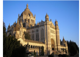
Bild: Basilika Sainte-Thérèse in Lisieux

Nähere Informationen im nächsten Pfarrblatt.