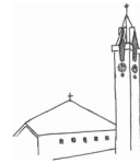
St. Antonius Eins., Bremke

Gott schenkt mir Wärme an kalten Tagen. Er ist mein "Kachelofen", wenn es draußen mal wieder so richtig stürmt und schneit.