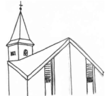
St. Cäcilia, Wenhthausen