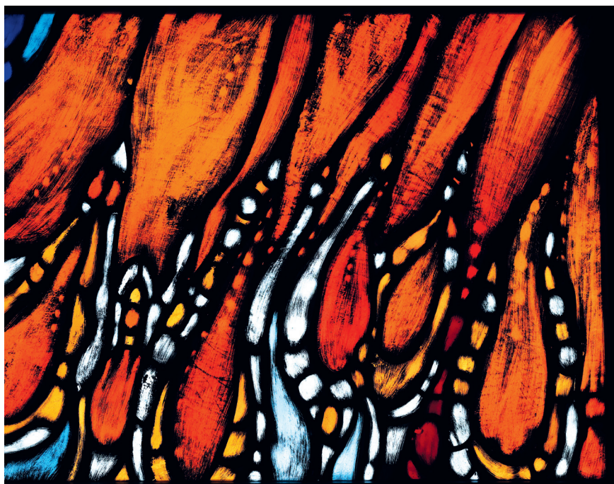
Bild: Pfingstfenster in St. Marien, Liederbach