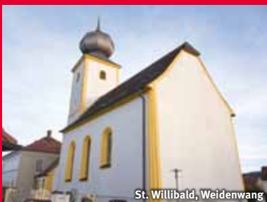
St. Willibald, Weidenwang