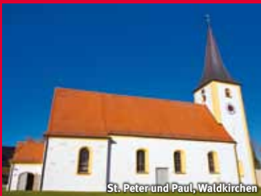
St. Peter und Paul, Waldkirchen