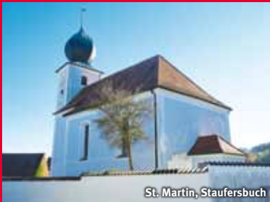
St. Martin, Staufersbuch