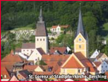
St. Lorenz u. Stadtpfarrkirche, Berching