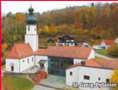
St. Georg, Pollanten