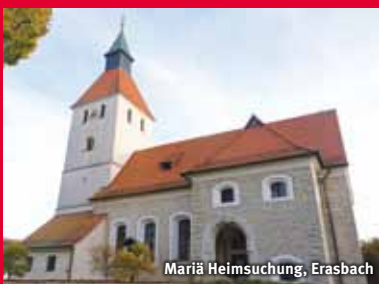
Mariä Heimsuchung, Erasbach