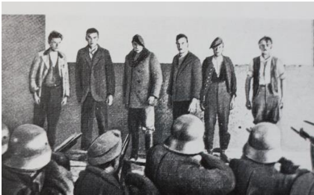
Rot gegen Schwarz: Erschießung von Jugendlichen

Sammlung Ostereuropahilfe, 11. Feb. für Kinderprojekte in Rumänien, Bulgarien, Bosnien und der Ukraine. In Kindertagesstätten der dortigen Caritas bekommen Kinder ein Essen, Schulmaterialien und Lernhilfe. Ein Drittel ist armutsgefährdet. Viele Romakinder müssen erst die Landessprache lernen. Die Wohnverhältnisse zu Hause sind desolat. Daher geben die Caritas-Heime Geborgenheit. Für Essen und Schulsachen ist Ihre Spende, Danke!